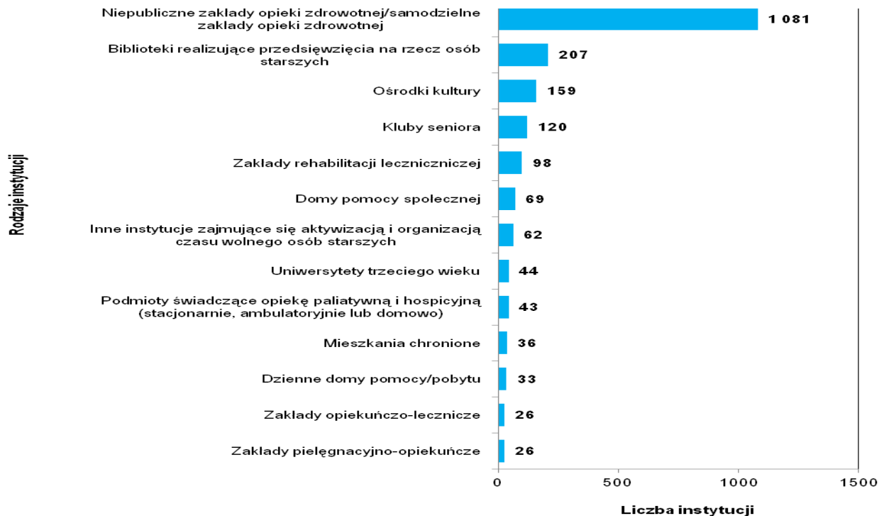
Wykres 4. Instytucje, z których mogli korzystać seniorzy wg stanu na koniec 2017 r.

Uwaga: Liczba odpowiedzi nie sumuje się do ogólnej liczby gmin/miast, które odpowiedziały na pytanie, gdyż dana JST mogła wskazać więcej niż jedną odpowiedź.