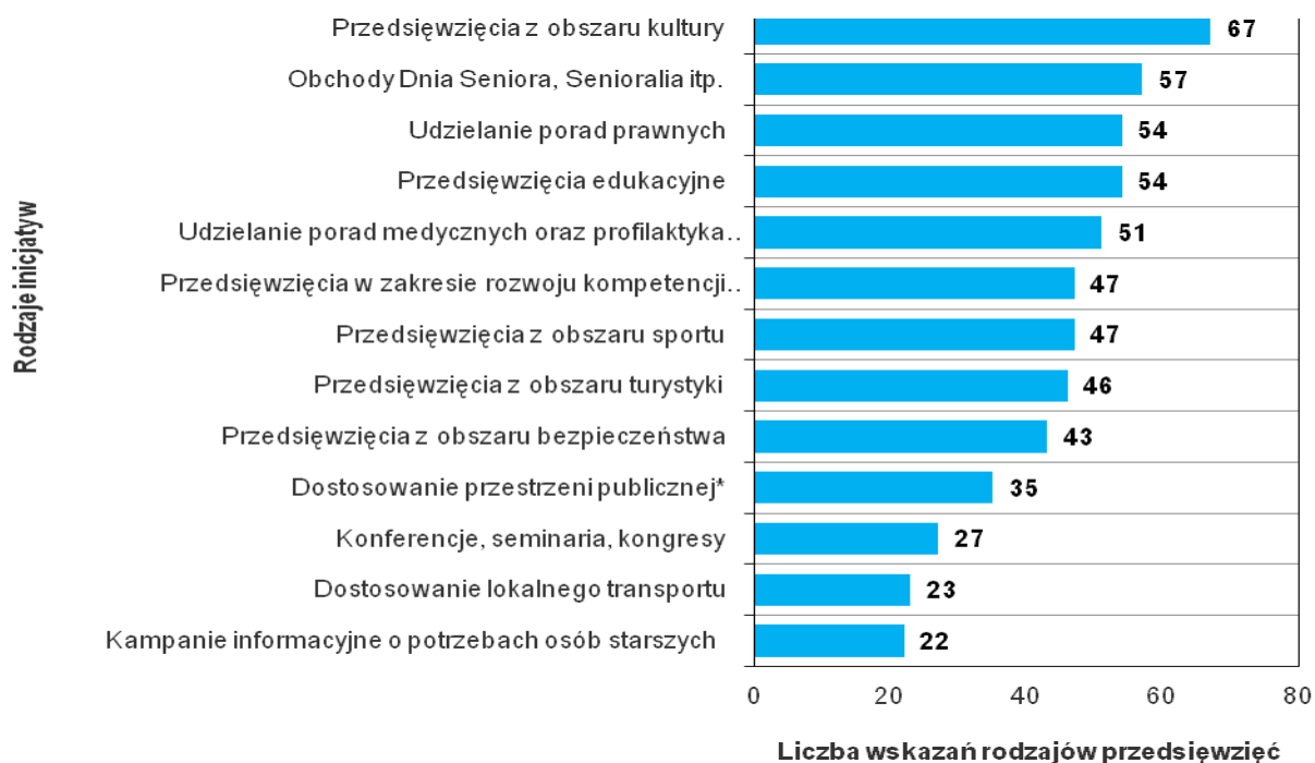
Wykres 5. Inicjatywy na rzecz seniorów w 2017 roku.

Uwaga: Liczba odpowiedzi nie sumuje się do ogólnej liczby gmin/miast, które odpowiedziały na pytanie, gdyż dana JST mogła wskazać więcej niż jedną odpowiedź.