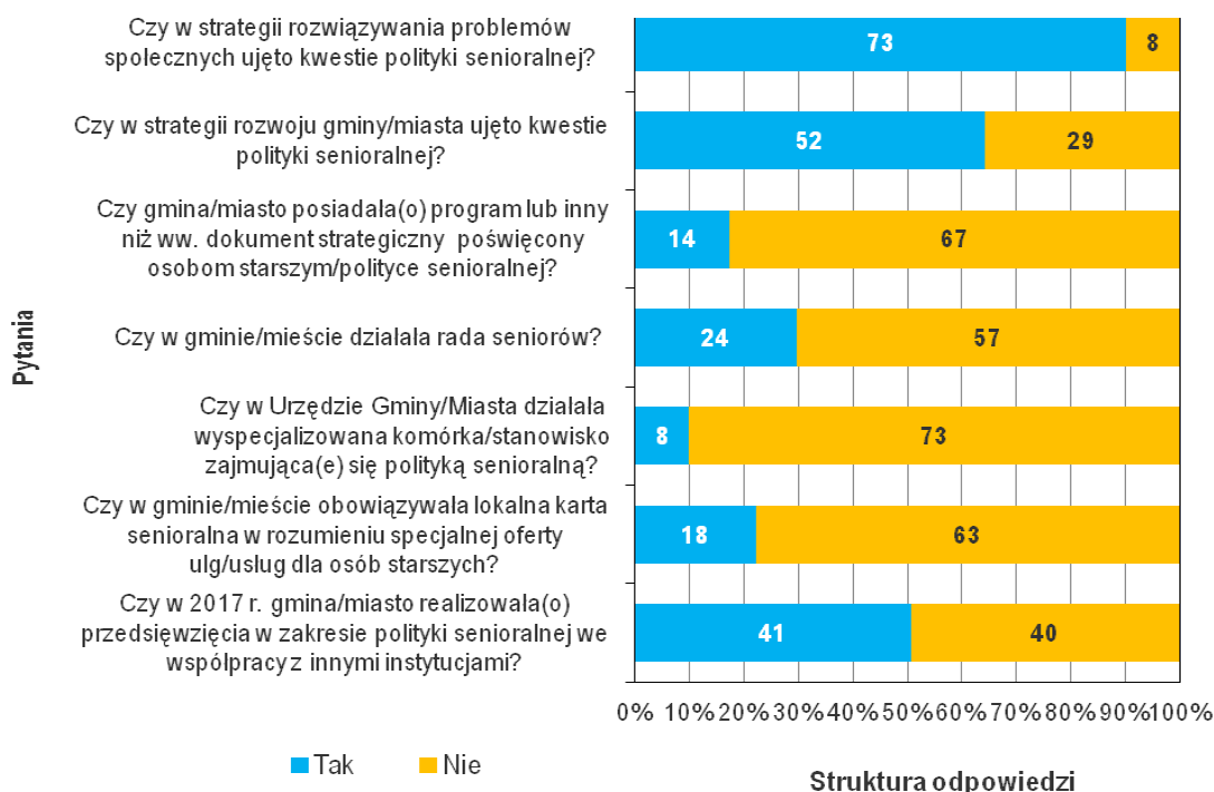
Wykres 1. Polityka senioralna w gminach (cz. 1)