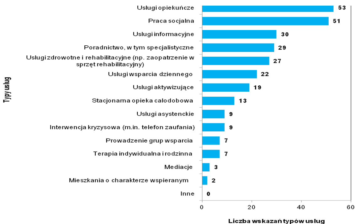
Wykres 3 Typy usług dla osób starszych organizowanych w gminie/mieście wg stanu na koniec 2017 r.

Uwaga: Liczba odpowiedzi nie sumuje się do ogólnej liczby gmin/miast, które odpowiedziały na pytanie, gdyż dana JST mogła wskazać więcej niż jedną odpowiedź.