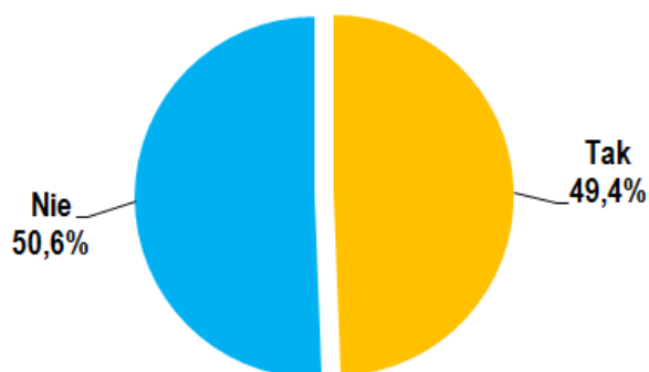
Wykres 6. Czy w 2017 r. seniorzy inicjowali działania na rzecz innych osób starszych?